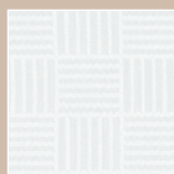
BW – brillantweiß