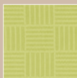
LI – limette