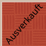
TC – terracotta