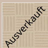
ML – mandel