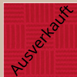
RU – rubin