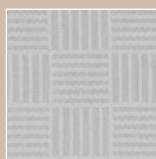
PL – platin