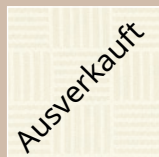
PE – perle