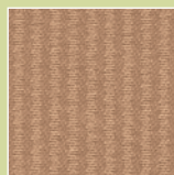
CP – cappuccino