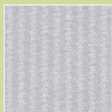
PL – platin