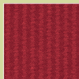
BG – burgund