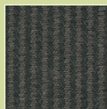
GU – grau