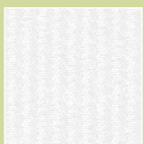
BW – brillantweiß