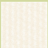
PE – perle