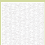
BW – brillantweiß