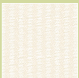
PE – perle