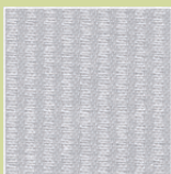
PL – platin