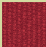
BG – burgund