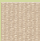
ML – mandel